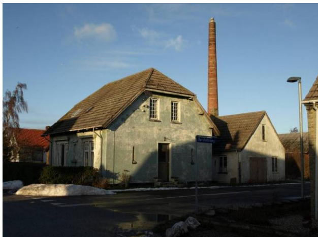
Hus i Gedser